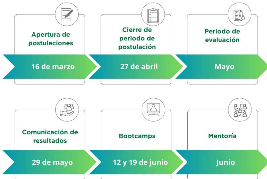
Figura 1. Plazos de ejecución fase 1